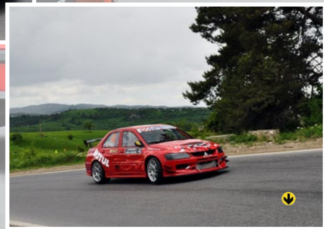
Campionatul Național de Viteză în Coastă Dunlop Muscel Racing Contest 2010 - GALERIE FOTO