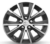
16" Diamante Topaze