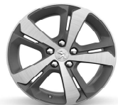
17" Diamante Rubis