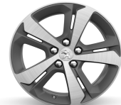
17" Diamante Rubis