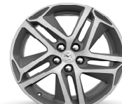
18" Diamante Saphir