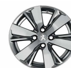
16" Diamanté Hyde Dilium grey