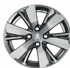
16" Diamanté Hyde Dilium grey