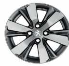
16" Diamanté Hyde Anthra