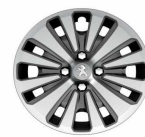
16" Strontium finisher- pt. BVMP