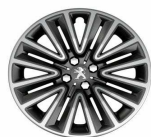
16" Two tone Silice finisher