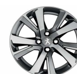
17" Diamanté Eridan Anthra grey