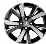
17" Diamanté Eridan Noir Brilian